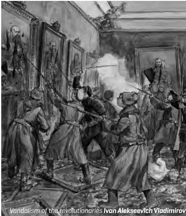
Vandalism of the revolutionaries Ivan Alekseevich Vladimirov

Bu gelişmeler kapitalist düzenin günümüzde yaratacağı tek bir soruna ilişkindir, ancak gelişmeler yukarıda da belirtildiği gibi toplumsal yaşamın bütün alanlarına yansıtacaktır.