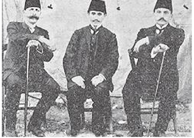
İttihat Terakki’nin ilk elemanlarından

Yaşadığımız coğrafyada yapılan her başarılı katliamın ardında, komprador burjuvazi, toprak ağaları ve onun siyasi temsilcileri yer alır. O dönemde özellikle Rum ve Ermenilere yapılan katliamlarda yer alan ezen sınıfların siyasi temsilcisi, “İttihat ve Terakki Cemiyeti” yer almıştır. Ermeni soykırımının yıl dönemine girdiğimiz şu günlerde, kaleme aldığımız dosyamızın bu başlığında; Ermeni soykırımını arkasındaki İttihat ve Terakki Cemiyeti’nin rolünü anlatmaya çalışacağız. Ermeni ve diğer azınlıklar üzerinde yapılan bu vahşette İTC’nin rolüne değinmeden önce, İTC’nin hangi amaçla kurulduğunu ve neyi hedeflediğine değinerek yazımıza giriş yapmanın doğru olacağı düşüncesindeyiz.