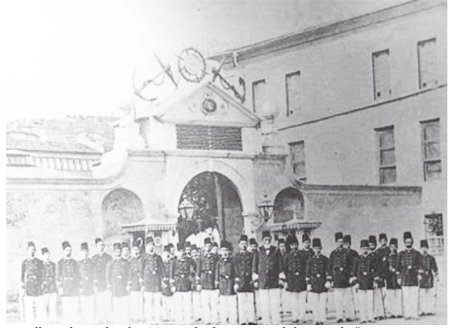
1900'lerin başında Elen Ticar Akademisi, Şimdi kapısında "DDK Deniz Lisesi Komutanlığı" yazıyor

kiliseler, okullar, kültür merkezleri, pek çok toplu olarak kullanılan mekanların geri iadesi üzerinde ya da yok edilen Ermeni varlığının tazmini üzerinden bir söylem geliştirilmemekte ve biz bu söylem üzerinden bir şeyler yapacağız 24 Nisan'da.