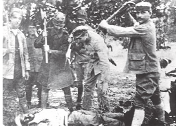
İttihatçılar görev başındayken