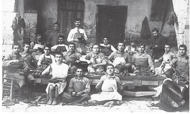
1900'lerde Ermeni çocukları

- "Birinin benim Ermeni olduğumu öğrenince, "Ne