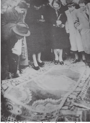
Varlık Vergisi hacizleri satılıyor

“Bu kanun aynı zamanda bir devrim kanunudur. Bize ekonomik bağımsızlığımızı kazandıracak bir fırsat karşısındayız. Piyasamıza egemen olan yabancıları ortadan kaldırarak Türk piyasasını Türklerin eline vereceğiz” (Şükrü Saracoğlu Parti grubu görüşmelerinden).