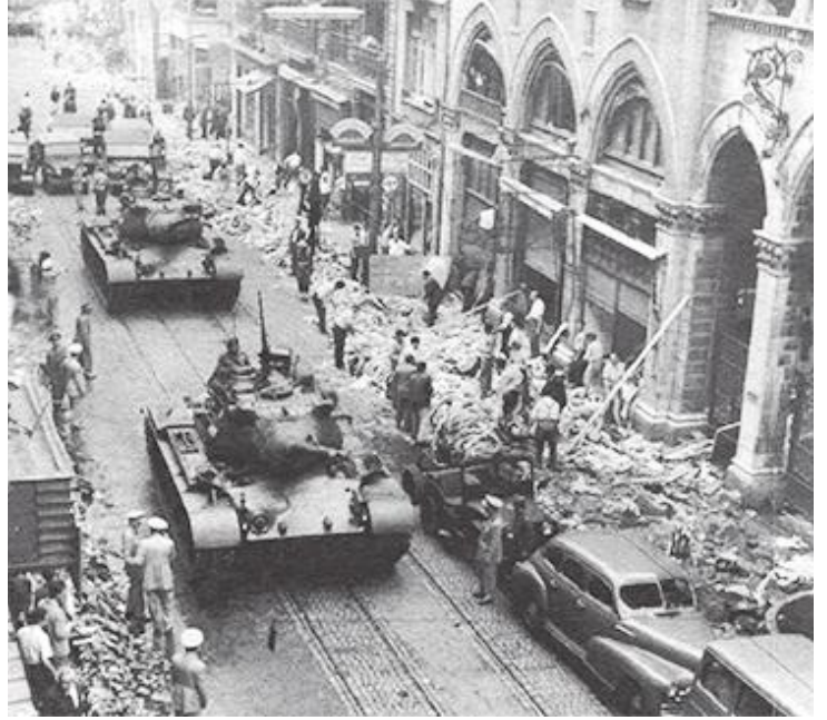
İstiklal Caddesi 1955- Rum katliamı devam ediyor!

Rum köylerini basacak ve emniyeti kendi elinde tutmak için çeteleri öne sürecektir. Bu çetelerden günümüze kahraman olarak lanse ettirilen " İpsiz Recep " ve " Topal Osman "dır. Topal Osman; insan öldürmede o kadar başarılı olacaktır ki daha sonra yeni kurulacak olan ülkenin meclis korumalığını üstlenecektir. Ve Sakallı Nurettin Paşa'nın yaptığı yağmanın, katliamın, vahşiliğin boyutu kontrol edilemez hale