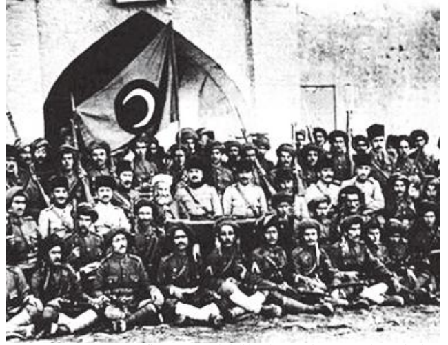
“Doğu Anadolu”da oluşturulan Hamidiye Alayları

19. Yüzyılın sonlarına doğru bir taraftan Osmanlı’nın Hamidiye Alayları (1890’ların korucuları) ile Ermeni halkı Van, Malatya, Elaziz (Ela-