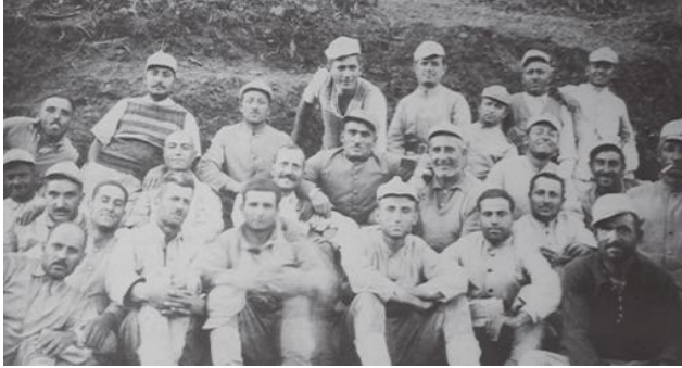
20 Kur'a amele taburlarından bir grup mola halinde

Bu yağma ve talanın yanı sıra vergilendirme ile devletin kasasına giren parada yukarıda bahsettiğimiz kadar adaletsizdi. “İstanbul’da 62 bin 575 mükellefe tahakkuk eden vergi 349 milyon 718 bin 812 liradır. 62 bin 575 mükellefin yüzde 6,7’sini Müslüman ve yüzde 86,9’u gayrimüslim olup geriye kalanda her iki gruptan karışıktı. 349 milyon 718 bin liralık verginin 25 milyon 600 bin 409 lirası (yüzde 7,3) Müslüman, 289 milyon 656 bin 246 lirası (yüzde 82,8’i) gayrimüslim mükelleften tahakkuk ettirildi. Ayrıca tutulmadan toplanan vergiyse 34,5 milyon liradır.” (Nevzat Onaran. a. g. e. sf. 543.)