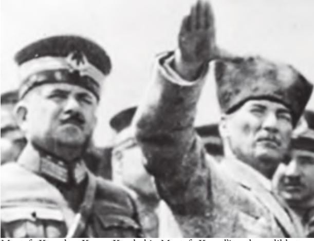
Mustafa Kemal ve Kazım Karabekir. Mustafa Kemal'in selamı dikkat çekici.

tirdi. 1914 yılında yapılan Ermeni soykırımı da içerisinde “İTC”nin kadrolarının yoğun bir şekilde yer aldığı gösterilir. Ermeni soykırımı aslında bir partinin, kendi varlığını, başka bir “azınlık” grubunu yok etmek ve mallarına el koymak üstüne hazırlandığına işaretler. O dönemde çıkarılan “Emval-i Metruke” (Terk Edilmiş Mallar) kanunu da Ermeni soykırımının sonrasına hazırlandığı ve Ermenilerin ekonomik zenginliklerine el koymaya yönelik bir kanundur. Kanunun içerisine bakacak olursak; Ermeni taşınır-taşınmaz mallarına yönelik el koyma ve boşaltılan Ermeni arazilerinin yönetimleriyle ilgili, yerlerine yerleşmenin yönetmeleriyle ilgili bir sürü kararname hazırlandı.