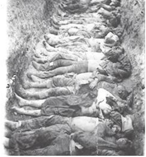
Ermeni'lere ait toplu mezar

miz dönemde, Orta Asya'da birden fazla "azınlık" yaşamaktaydı ve İTC'nin politikalarının önünde bir engeldi. İTC'nin ideolojisinde kesinlikle azınlıklara yer yoktu. Bu güzergahta ilerleyen İTC birden fazla katliama ve vahşete imza attı. Yani esasta baktığımız zaman dönemin yara almış komprador burjuvazisi ve toprak ağalarına bir ulus gerekiyordu.