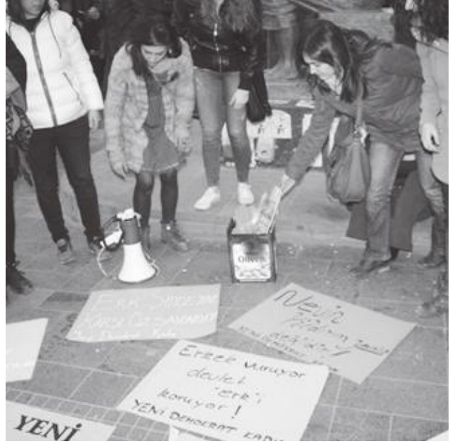
Ankara’da Nevin eyleminden: “Erkek Adalet Yanarken”

Büyüdün ve hizmet çağın başladı. Önce babana,