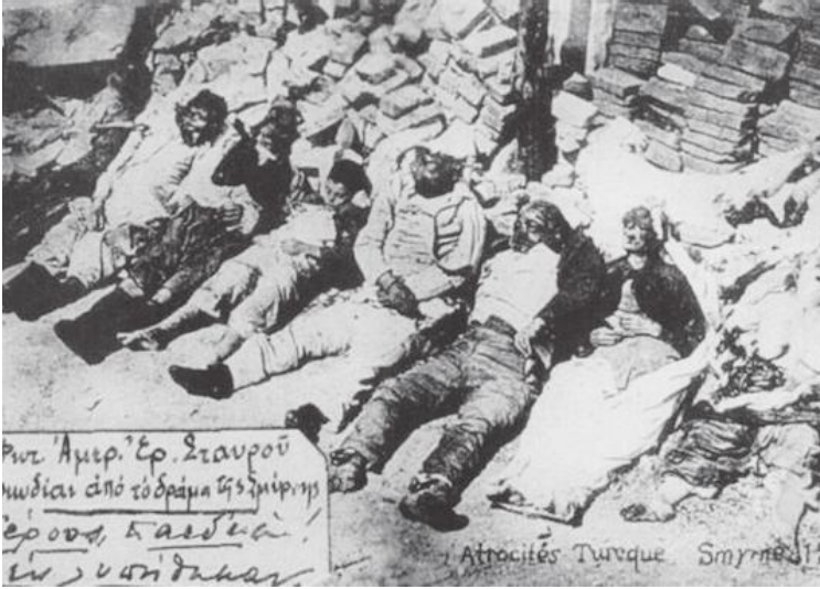
Karadeniz'de Rum katliamından