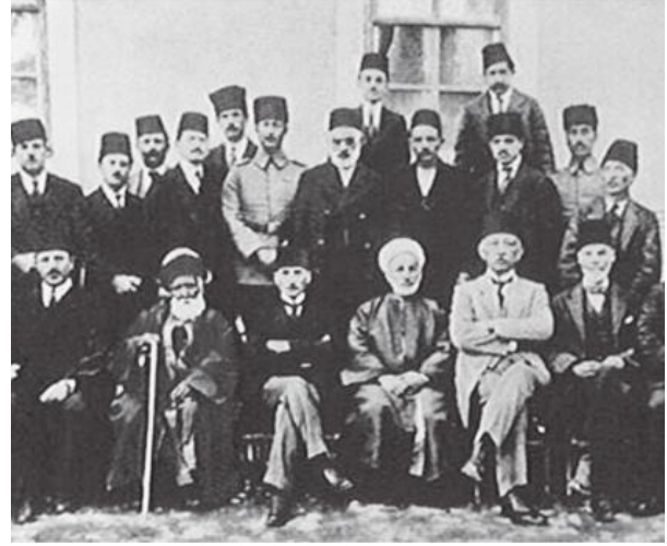
Sivas Kongresi'ne katılanlardan bir grup

Ermenilerin İngilizlerle anlaşıyor söylemi ve "Kurtuluş Savaşı" için "7 düvele karşı" niteliğinin biçilmesi, tarihi ters düz etme çabasından ve gerçeği inkârından başka bir şey değildir. TC'nin Milli Mücadele'den anladığı şey; gayet omurgasız ve onursuz