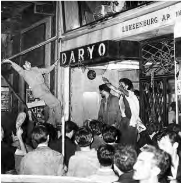
6-7 Eylül Olayları- İstiklal Caddesi

Günümüzde yapılan katliamların karakteristik özelliği; Osmanlı’nın, Türkleştirme projesiyle beraber vücut bulmuştur. Ülkede yapılan katliamların bir çoğunu, halk kitlesi gözünde meşrulaştırmak için Türk hakim sınıfları