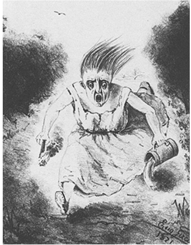
Eugène Girard, “La Femme, éman-cipée, répandant la lumière sur le monde” [Dünyaya Işık Saçan Özgürleşmiş Kadın], 1871.

Pétroleuse’ün analizinde yaş ve sınıf önemlidir, olgun, vahşi ve tehditkar olmalarının nedenini açıklar. Komün’ün Marianne imgeleri sorunludur ve, iddia ediyorum ki, şeytanlaştırılmış Pétroleuse miti ile birbirine bağlı bir alegoridir. Genç, güçlü ve halkının koruyucusu olarak idealize edilmiş Marianne’nin aksine o burada sapkınlaştırılır. Burada Marianne, şehrinin yerle bir eden ve tamamen kontrolden çıkmış, militan, solcu Paris’i temsil eden bir Pétroleuse olarak tasvir ediliyor. Şimdi, komünün son günlerinde Paris’in bazı bölümlerini yakmakla suçlanan dönemin Pétroleuse klişelerine uyuyor ve şiddet içeren, yıkıcı, politik olarak aktif, dizginlenmemiş ve dolayısıyla tehditkar bir kadın imajı yaratıyor. Fransız yazar ve komünar Benoit Malon’un özetlediği gibi, “Hepsinden önemlisi, Paris devriminin gün ışığına çıkardığı önemli bir gerçek, kadınların siyasete girme-