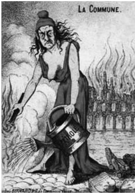
Bernard, "Une Pétroleuse de la Commune" [Komün'ün Pétroleuse'ü], 1871.

Eugène Girard'ın alaycı bir şekilde "Dünyaya Işık Saçan Özgürleşmiş Kadın" adlı görseli, kadınların siyasi gücüyle birlikte algılanan yıkımı göstermektedir. Girard'ın Pétroleuse'ü ya da özgürleşmiş kadını (şimdi aynı şekilde muamele görüyor), bir elinde yanan meşalesini diğer elinde ise onu yakmak için kullandığı petrol tenekesini taşıyarak aydınlattığı dumanlı bir karanlıktan ortaya çıkıyor. Geniş, ateşli gözlerle, ağzı açık, vahşice uçuşan saçlarıyla izleyiciye doğru saldırgan bir şekilde koşarken karşımıza çıkıyor. Burada özgür-