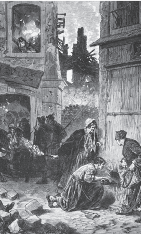
LIX Frédéric Théodore, "Les Séides de la Commune, les pétroleuses et les enfants perdus" [Komün'ün Yardımcıları, Pétroleuseler ve Kayıp Çocuklar], 1871