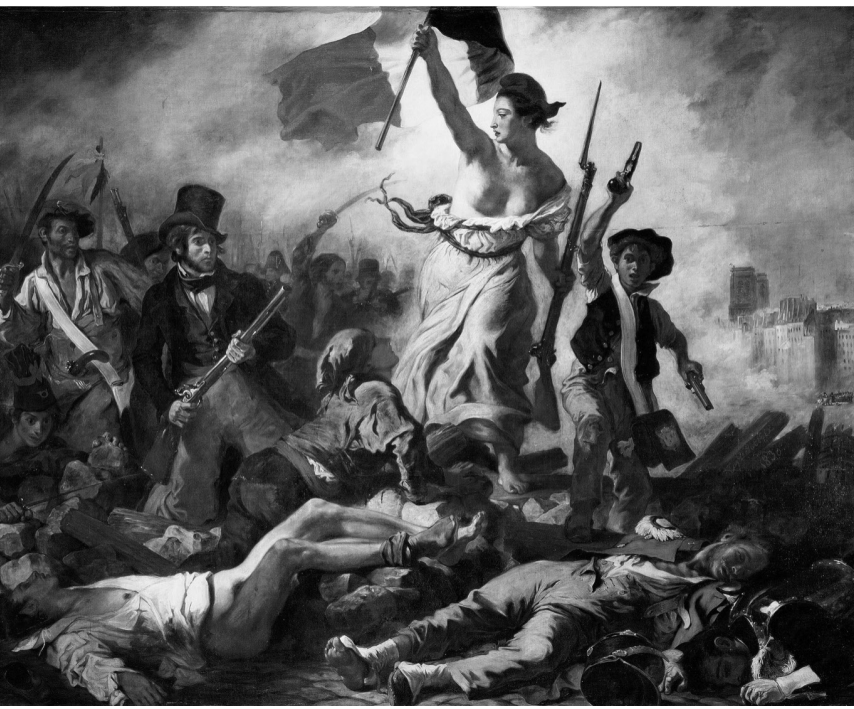
Sol: Eugène Delacroix, "La Liberté guidant le peuple" [Halka Yol Gösteren Özgürlük], 1830. Sağ: Honoré Daumier, "La République" [Cumhuriyet], 1848.