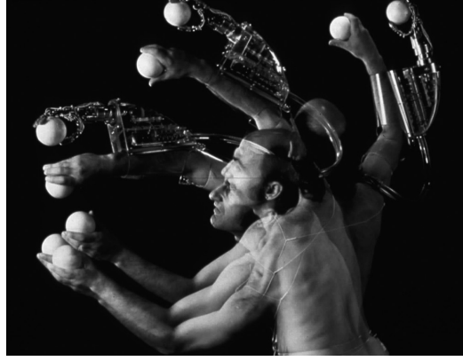
Stelarc, Third Hand - 1980

Bize düşen ise bunları doğru temelde örgütleyebilmek, hazırlanabilmek, kurtuluş için, sistem içi her talebin yönünü yeni bir düzenin yaratılmasına doğru geniş-